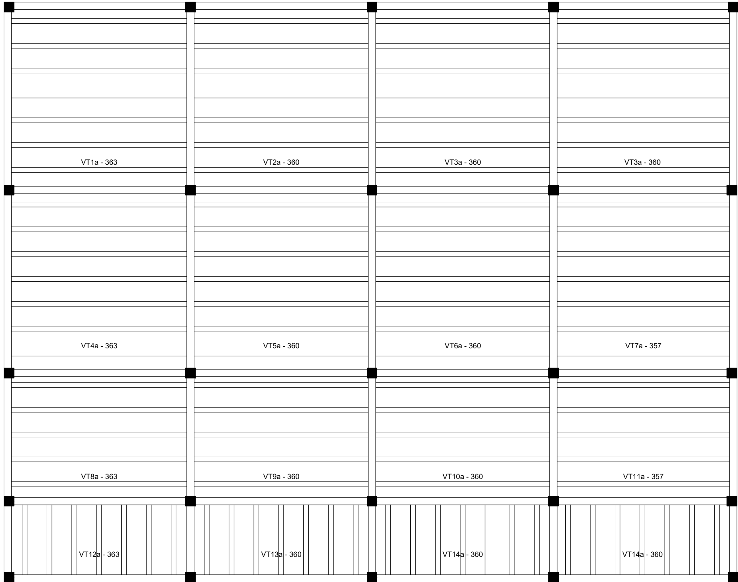
Planta de vigotas pré-moldadas escala 1:50